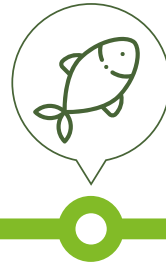
Seafood Thủy sản