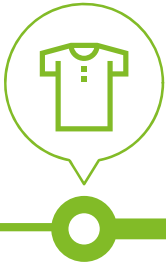
Garment May mặc