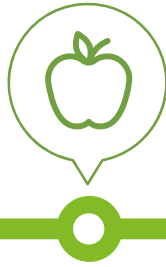
Food Thực phẩm