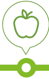
Food Thực phẩm