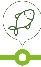
Seafood Thủy sản