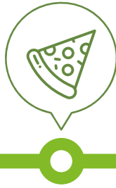
Agricultural products Nông sản