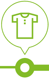
Garment May mặc